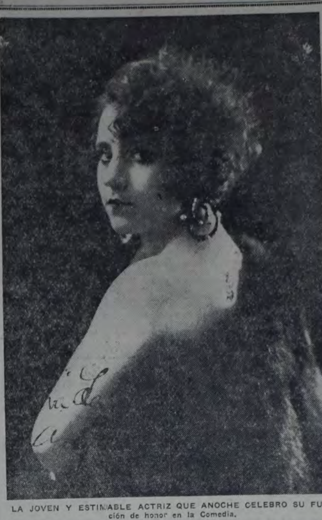
LA JOVEN Y ESTIMABLE ACTRIZ QUE ANOCHÉ CELEBRO SU FUNCION DE HONOR EN LA COMEDIA