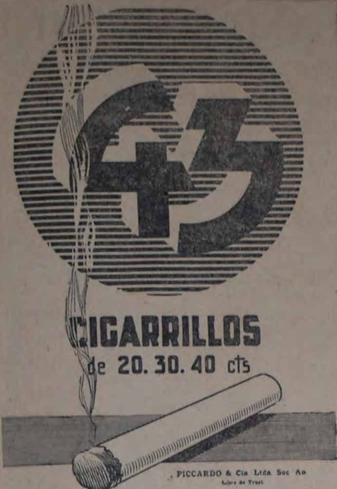
PICCARDO & Cia Ltda Soc An Libre de Trasl