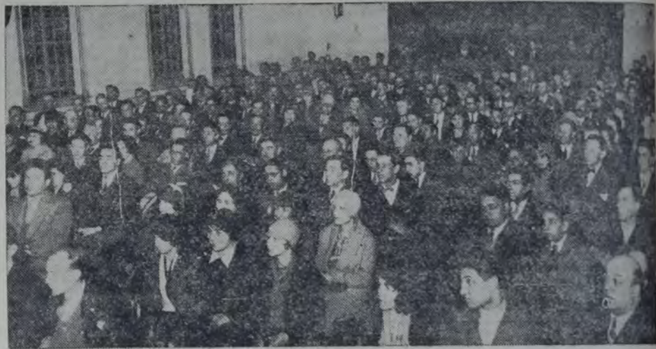
EL PUBLICO QUE LLENABA EL SALÓN DE ACTOS DE LA CASA DEL PUEBLO DURANTE EL FESTIVAL organizado por la Biblioteca Obrera con motivo de su XXXI aniversario.

decreto que la rebaja aconsejada reduce el porcentaje de los beneficios de la empresa a un límite razonable, compatible con sus necesidades financieras e inferior al mismo tiempo al autorizado como máximo por el artículo 50. de la ley 5315. Queda ahora pendiente el estudio financiero del ferrocarril Buenos Aires al Pacífico que está a punto de terminar la Dirección general, y que motivará de inmediato un tercer decreto ordenando una rebaja de varios millones de pesos en las tarifas de esta empresa. Ignoramos el motivo por el cual se ha excluido al ferrocarril Oeste, como corresponde igualmente, la consecución de una rebaja necesaria de sus elevadas tarifas. Hemos querido informarnos al respecto sin obtener ninguna explicación satisfactoria sobre tan extraña exclusión.