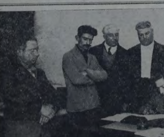
LA COMISION DE CHOFERES QUE VISITO "LA VANGUARDIA" PARA INFORMARNOS SOBRE SU EXCELLENTE INICIATIVA...